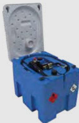
REZERVOR 230 LITRI