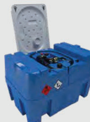
REZERVOR 440 LITRI